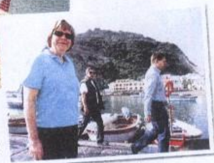
Italienische Momente: Signora Angela, ihr Mann Joachim Sauer (rechts)

spendenskandal und Oppositionsgetöse plötzlich ihre Knochen, Sehnen und Muskeln gespürt haben. Anders ist nicht zu erklären, warum sie auf Ischia kam. Für jemanden, der im Osten aufgewachsen ist, war Italien nämlich kein Sehnsuchtsort. Man kannte den „Tod in Venedig“, die gesellschaftskritischen Filme Viscontis und Bertoluccis. Die lustigen Filme mit Sophia Loren und Cary Grant jedoch, das „Trinke, Auge, was die Wimper hält“-Italien – das kannte man nicht. Das Italien des Ostens hieß damals bekanntlich Bulgarien.