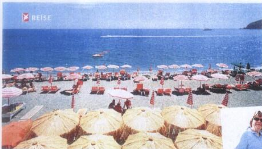
Am Spiaggia del Maronti, dem mondänsten und längsten Strand der Insel (2,5 Kilometer), wurde 1959 „Nur die Sonne war Zeuge“ mit Alain Delon gedreht