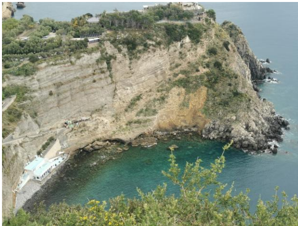
Abb.4: geschichtete Pyroklastika Sorgeto Bucht

Gleichzeitig liegt Ischia in einem Erdbebengebiet . Kleinere Erderschütterungen der Stärke 1 und niedriger werden mehrmals über das Jahr gemessen. Spürbar sind sie selten. Am 28. Juli 1883 gab es ein Erdbeben , das die Gemeinde Casamicciola im Norden der Insel fast vollständig zerstörte und 2.333 Menschenleben forderte. Ein ähnlich starkes Erdbeben , ebenfalls mit dem Epizentrum in Casamicciola, ereignete sich im August 2017. Es hatte „nur „die Stärke 4.1, führte aber dennoch zum Einsturz von Gebäuden und Mauern.