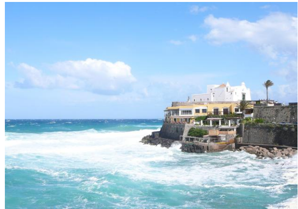
Abb.3: Sturm Ischia