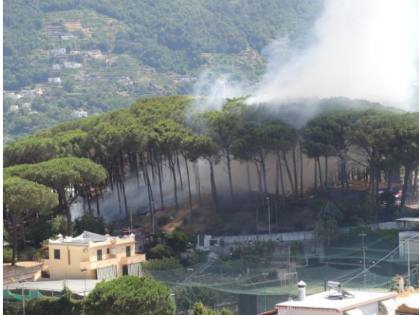
Abb.6: Waldbrand Ischia

Hin und wieder kommt es auch zu Buschbränden auf Ischia .