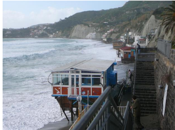
Abb. 1: Georisiko Sturm am Maronti Strand

Im Folgenden wird näher auf diese Risiken und ihre Auswirkungen eingegangen, wie präsent sie auf Ischia sind und wie man sich vor ihnen schützen kann