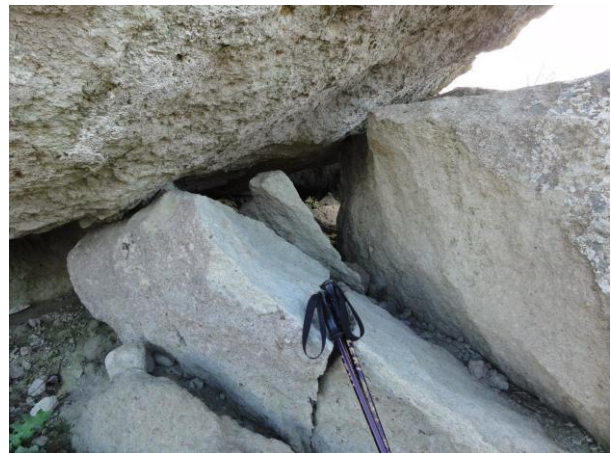
Abb.2: Durch Gravitation üben riesige Felsbrocken Druck aufeinander aus, was zum Bruch und Absturz der Felsen führen kann

Kommt es dann vermehrt zu Starkregenereignissen, hervorgerufen durch den Klimawandel, steigt das Risiko einer Massenbewegung erheblich.