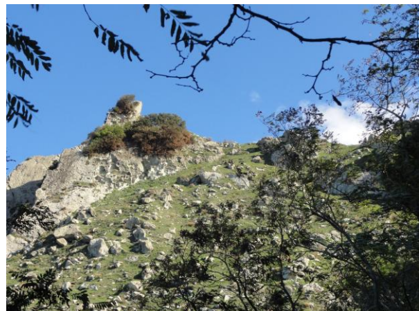
Abb.5: Felsenmeer Ischia

Auch an den Bruchkanten einzelner Erdschollen, die bei der Entstehung der Insel Ischia unterschiedlich stark aus dem Wasser gehoben wurden, lösen sich mit der Zeit größere Felsblöcke ab, die aufgrund der Gravitationskraft nach unten stürzen und auf der nächst tieferen Ebene liegen bleiben. Solche Ansammlungen von großen Felsquadern nennt man Felsenmeer. Auf der Westseite der Insel entlang des Höhenweges Via Panoramica kann man solch ein Felsenmeer sehr gut erkennen (Abb. 5).